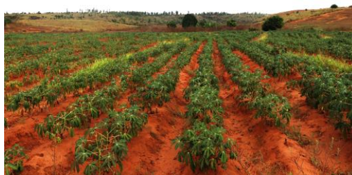
Photo de gauche : impact du feu à Boeny © PADDI/ GIZ Photo de droite : paysage productif sur les pares-feu agricoles à Boeny © PADDI/ GIZ