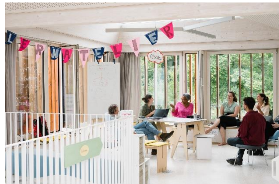
Praxisorientierte Lernangebote in kleinen Gruppen