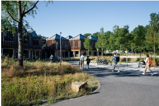
Unser Lernstandort: Campus Kottenforst in Bonn-Röttgen