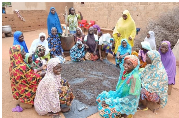
Des membres d'un groupe local de femmes en train de préparer du « Sombala », un condiment traditionnel d'Afrique de l'Ouest.

Les activités de relance économique sont cofinancées par l'UE et mises en œuvre en consortium avec l'Agence belge de développement (Enabel).