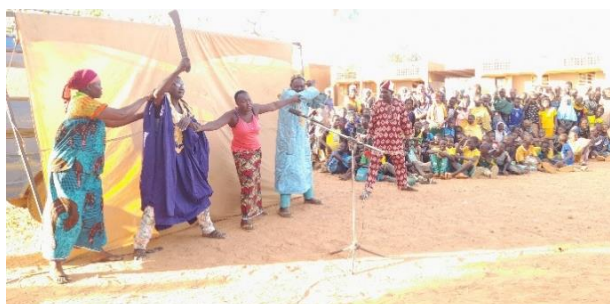
Des élèves de Kongoussi participent à une séance de sensibilisation sur l'accueil et le soutien de leurs camarades