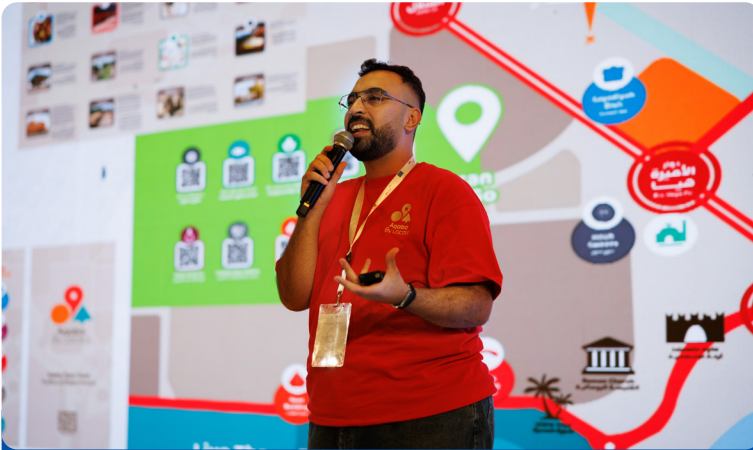
ريادي يعرض مشروعه الناشئ

بالإضافة إلى ذلك، فإن الشركات الناشئة غالباً ما تكون لديها إمكانيات نمو محدودة. يواجه النظام البيئي الريادي أيضاً العديد من التحديات. غالباً ما تكون الظروف الإدارية غير مواتية لرواد الأعمال. فالحقبات الإدارية والعمليات البيروقراطية تشكل عوائق كبيرة. علاوة على ذلك، فإن هناك نقصاً في تقديم الدعم والتعاون في المنطقة. ونتيجة لذلك، لا يستطيع رواد الأعمال استغلال الأسواق المحلية والإمكانات التجارية بالكامل.