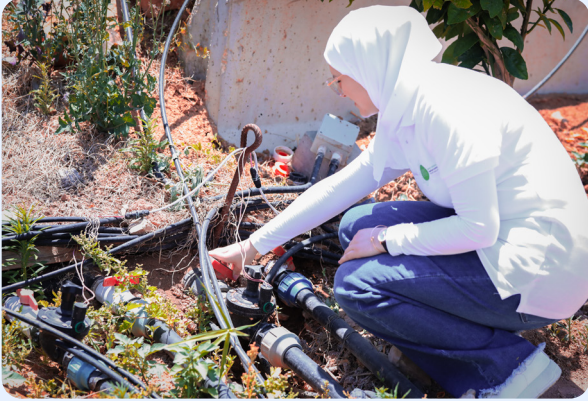
رائدة أعمال تختبر نموذجًا أوليًا للمنتج