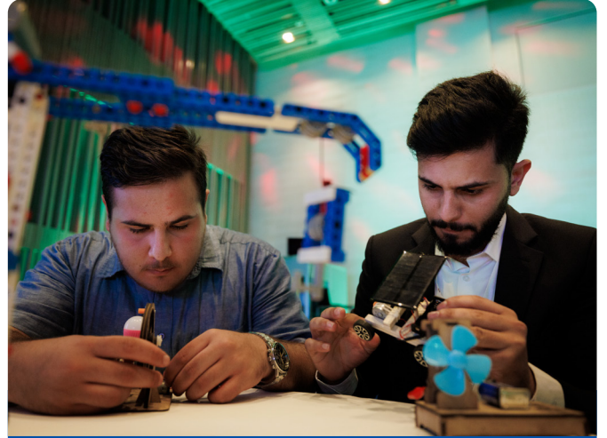
رواد أعمال يعرضون منتجاتهم

يتم تحديد أفكار لأعمال ومواءمتها مع احتياجات السوق من خلال ورش عمل متخصصة لكل قطاع. ويركز هذا النهج معالجة الفجوات في المنتجات والخدمات وسلاسل القيمة المحددة لكل محافظة. بالإضافة إلى ذلك، يتم ربط الشركات الناشئة بشركات راسخة، إما كموجهين أو كمشتريين محتملين لمنتجاتهم وخدماتهم.