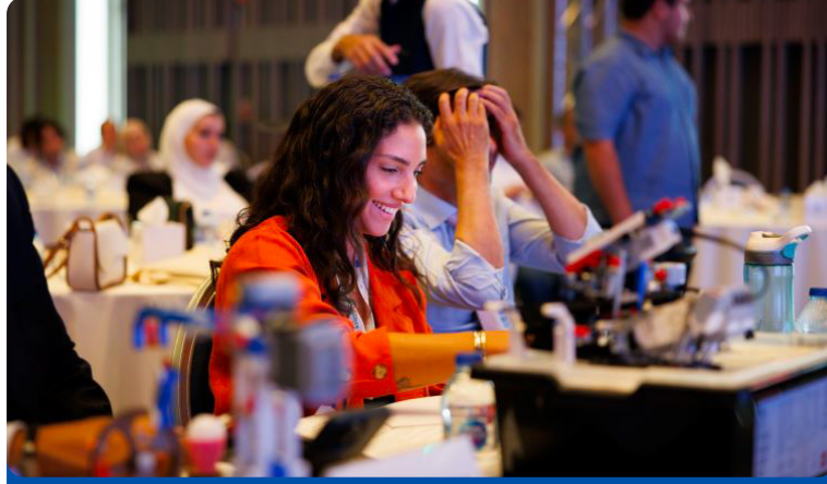
لجنة التحكيم في مسابقة سفراء الريادة في الجنوب

البرنامج متعدد المانحين حيث أن مشروع "ريادة الأعمال من أجل التنمية الاقتصادية المستدامة والتشغيل" يتم تمويله بشكل مشترك من قبل الاتحاد الأوروبي ووزارة التعاون الاقتصادي والتنمية الألمانية (BMZ) ويُنَفَّذ من قبل GIZ وبالشراكة مع وزارة الاقتصاد الرقمي والريادة (MODEE).