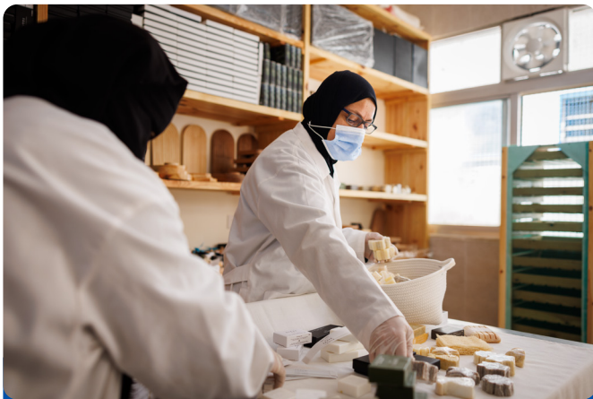
رائدات أعمال ينتجون الصابون الطبيعي

ينظم البرنامج فعاليات البرمجة (Hackathons) وبرامج التسريع وغيرها من المبادرات مع التركيز بشكل خاص على دعم الشركات التي تقودها النساء.