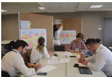
Izquierda: Reunión del Consejo Consultivo del AdaptaInfra